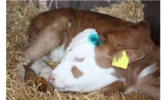
Abb. 5: Schlafendes Kalb ca. 1h nach dem Enthornen

Tier in Bauch-Brustlage, gut gepolstert und in ruhiger Umgebung lagern, im Winter besonders gut gegen Wärmeverlust isolieren.