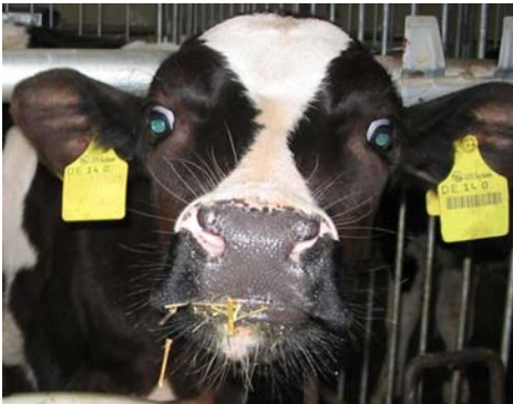
Abb. 1: gesundes, frühenthorntes Kalb ca. 2,5 Wo alt

Der Einsatz von Schmerz- und Beruhigungsmitteln (Analgetika und Sedativa) beim Enthornen von Kälbern gehört heute zur guten fachlichen Praxis.