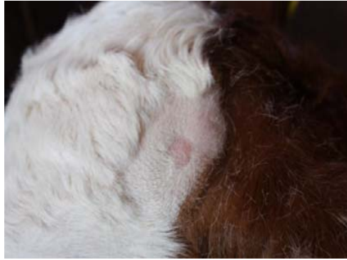
Abb. 3: Scheren des Bereiches der Hornknospen Kalb hier 4. Lebenstag