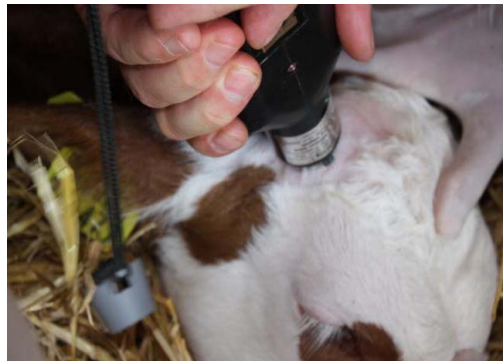
Abb. 4: Ringförmiges Veröden der Hornknospen